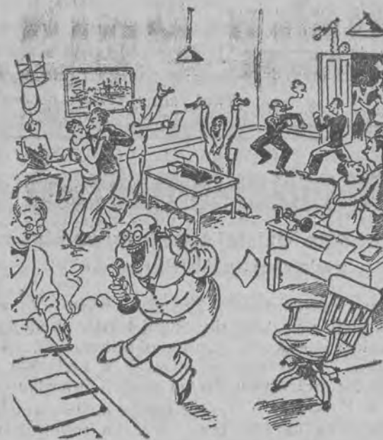
Kiedy szef wychodzi na randkę...