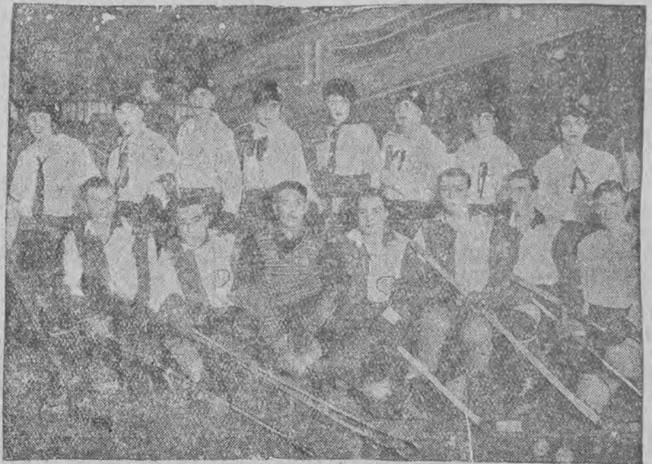
Hockey'owa drużyna kobieca

Jednocześnie magistrat zwrócił się do rady miejskiej o uznanie wszystkich pozostałych terenów za budowlane.