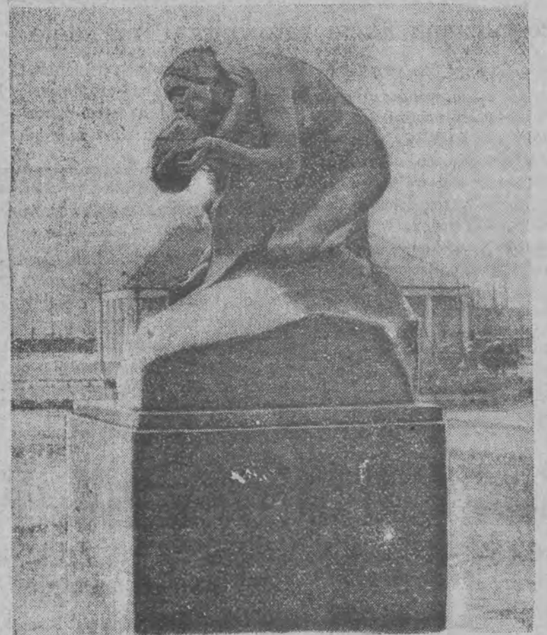
Rzeźba p. Wacława Szymanowskiego „Macierzyństwo”, została odsłonięta 20 b. m. w parku Traugutta.