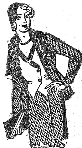
Kostjum z tweedu z bogatym przybraniem z breitszwanców i kamizelką z gładkiego materiału w innym kolorze.