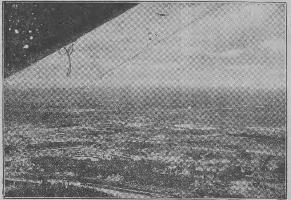
Zdjęcie wykonane z pokładu „Hr. Zeppelina” podczas drugiego lotu śródziemnomorskiego.