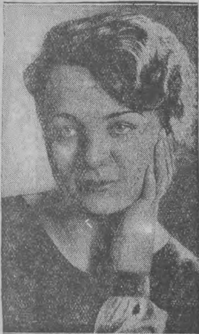
Słynny bokser Maks Szmelling został pokonany przez czeską artystkę Jarmilę Bokową, z którą się zaręczył.