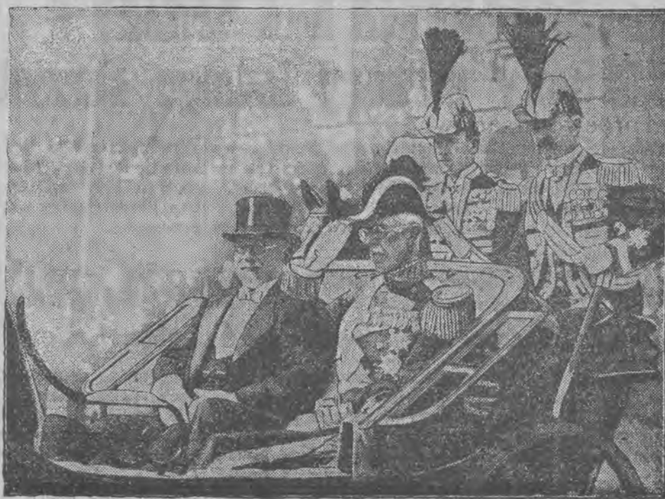
Przejście przez sztokholmską podwójną ulicę przed pałacem