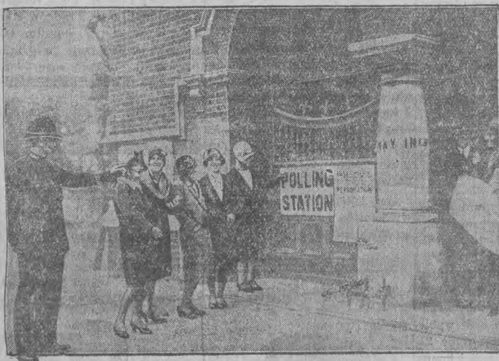
Podlotki, które dopiero teraz otrzymały prawo głosu, brały żywy udział w wyborach

LONDYN, 2 czerwca. (Tel. wł. „Głosu Porannego“). Nie ulega już najmniejszej wątpliwości, że dni gabinetu Baldwin-Chamberlain są policzone i że na czele nowego rządu stanie Mac Donald, mając przeciwko sobie rzeczową opozycję konserwatystów, a za sobą cichą życzliwość lewego skrzydła liberałów. Konserwatyści, licząc że ze zwrotem w opinii wyborców, nie będą usiłowali obalić rządu robotniczego, a pozwolą mu spokojnie pracować nad realizacją części zapowiedzianego programu. Wobec sytuacji obecnej jest więcej, niż pewnem, że Mac Donald będzie w polityce wewnętrznej i socjalnej stawiał bardzo ostrożnie każdy krok i że np. sprawa socjalizacji kopalń nie będzie za tych rządów labour party zrealizowana. Również podwyższenie zapomóg dla bezrobotnych będzie miało bardzo umiarkowany charakter, bowiem konieczne na ten cel wydatne podwyższenie podatków spotka się napewno ze sprzeciwem sfer posiadających, t. j. konserwy i liberałów. Natomiast budowa domów robotniczych będzie zrealizowana w szerokim zakresie, bowiem ten postulat nie natrafia na sprzeciw rzeczowej wprawdzie, ale tem nie mniej czuwającej bacznie nad swymi interesami nowej opozycji.