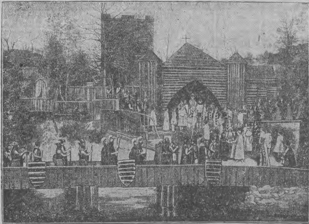
odegrane będą w roku bieżącym w Bentheimie (nieдалeko granicy holenderskiej)