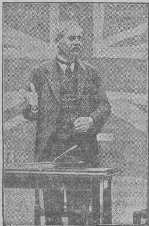
Ramsay Mac Donald przemawia na ostatnim wiecu wyborczym

W przeciwieństwie do polityki wewnętrznej, w sprawach zagranicznych będziemy napewno niebawem świadkami zasadniczych posunięć. Mac Donald będzie musiał przystąpić do nawiązania kontaktu bliższego z Rosją i napewno nastąpi zwrot ku lepszemu w stosun-