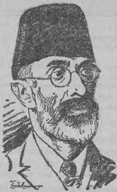
nowy król Afganistanu