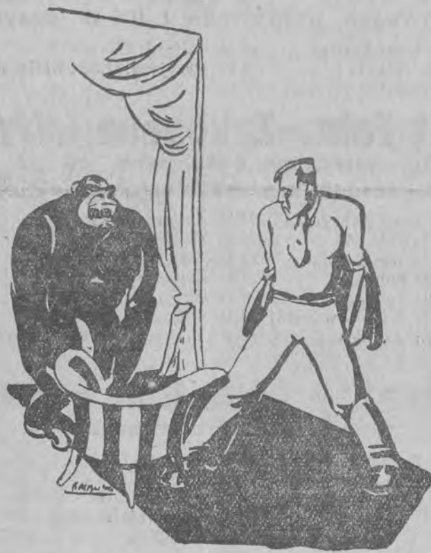
— Dam sobie radę z tym pasażerem...

Podszedł z tyłu do goryla, chwycił go silnie za szyję i pociągnął na dywan. Jack bez namysłu sięgnął stalowemi palcami do dławiącej go pętlicy. Bob tymczasem przesunął ręce pod kończynami goryla i złaczył je na jego plecach, poczem posunął je wwyż, aż do karku bestji. Opierając się całą siłą na plecach zwierzęcia, naciskał co raz silniej jego głowę.