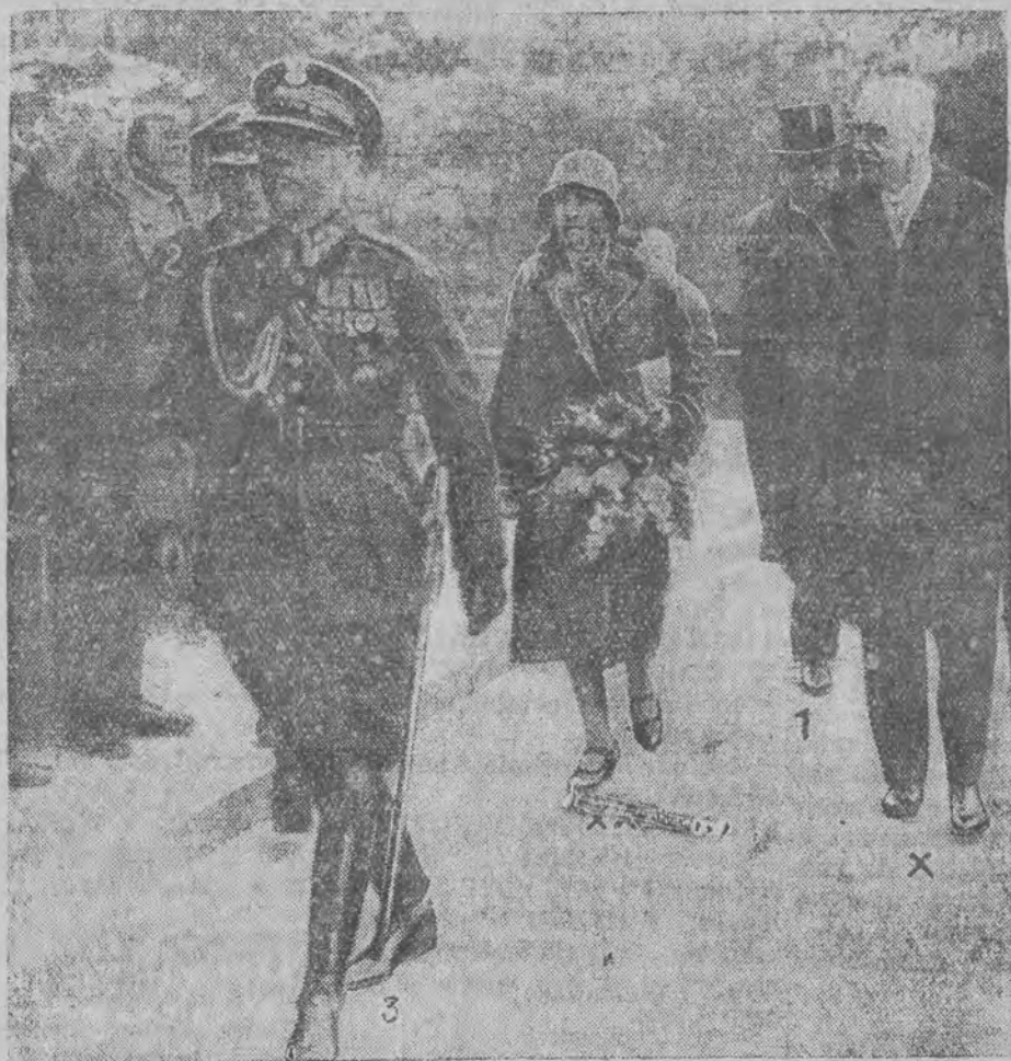
Po przeszło dwutygodniowym pobycie w Poznaniu, Pan Prezydent Rzeczypospolitej powrócił do stolicy.