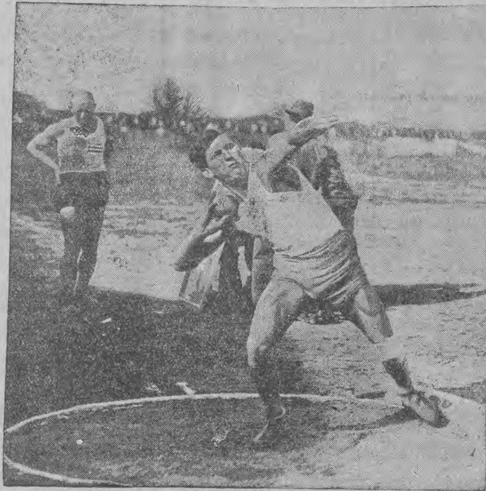
Heljasz (Warta) w rzucie kulą 13,45 mtr.