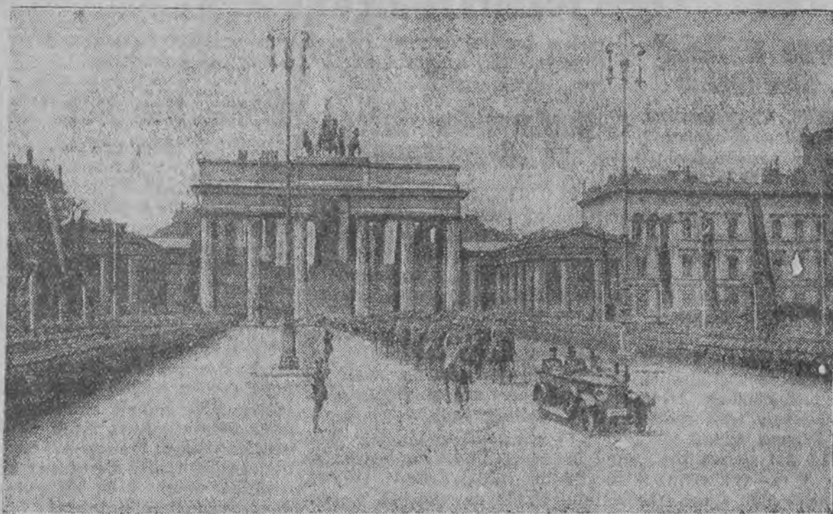
Wjazd do miasta przez wrota brandenburskie w asyście szwadronu Reichswehry.

jest entuzjastycznie przyjmowany przez oficjalne sfery Berlina