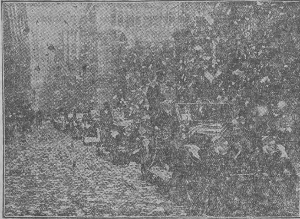
Deszcz confetti zasypuje formalnie tryumfalny kondukt