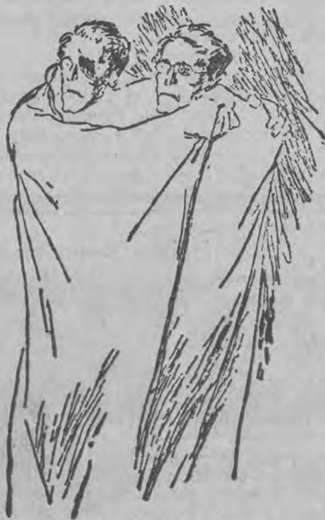
...Wystawały tylko głowy...

stepujących sen, byłbym w stanie 24 godziny na dobę pracować, względnie żyć, co nieraz może znaczyć to samo, — co mógłbym wtedy stworzyć? Wy dostałbym się o trzy stopnie po schodach, liczących 100 stopni. Niczego nie można dokończyć, wszystko tylko zacząć. Podobnie jak nie mogę jednocześnie myśleć dwu myśli, nie mogę również być jednocześnie w dwu miejscach. Rozumie pan?