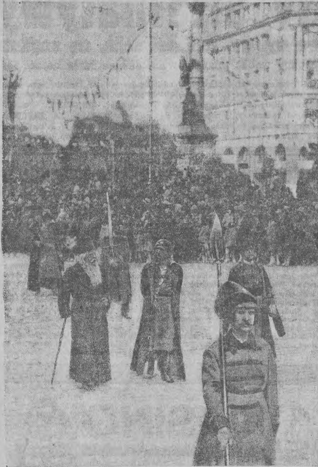
Fragment wspaniałego pochodu, który uświetnił otwarcie tegorocznych Targów Wschodnich we Lwowie. Zdjęcie przedstawia grupę historyczną typów mieszczańskich: Polaka, Rusina, Ormianina, Greka i Żyda. Szczegóły tego święta opisał nasz korespondent lwowski w specjalnej korespondencji w „Głosie Porannym“.