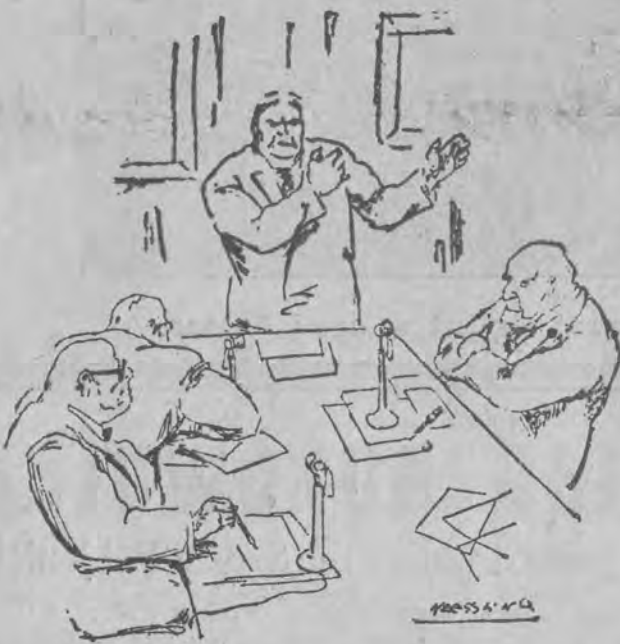
To pirat. Wylania nam zyski z przed nosa...

— Niema żadnego celu owijać prawdę w bawełnę, ukrywać się za parawanem dyplomatycznej grzeczności. Wszyscy tu zgromadzeni wiedzą, co chcę tutaj powiedzieć, ale nikt z nich nie ośmielił się dotychczas na wyraźne wystąpienie. Nietylko kupujący od nas odchodzą, ale opuszcza nas również najlepszy personel. Dlaczego? Ponieważ mr. Brooker nagle zniósł obowiązujące dotychczasienne wymówienia i zamienił na kilkumiesięczne; obiecał nie stosować wydalania tych urzędników, którzy z powodu podeszłego wieku nie mogą pracować tak, jak przedtem i t. p. Mr. Brooker kupuje drożej, niż my i dlatego w całym kraju dostaje najlepsze to-