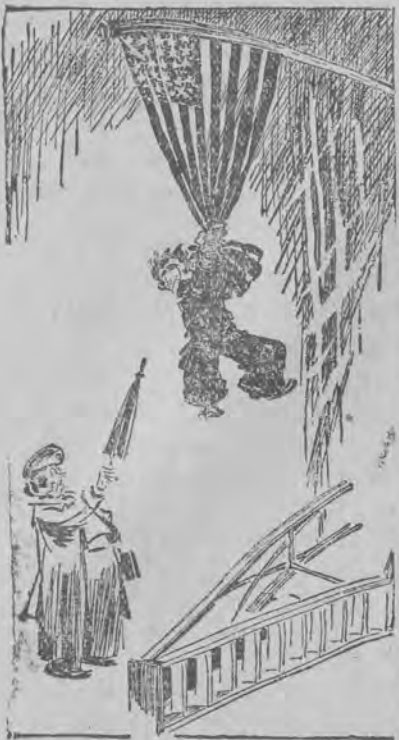
— Ostrzegam pana! Za zerwanie sztandaru grozi więzienie! („Judge”)