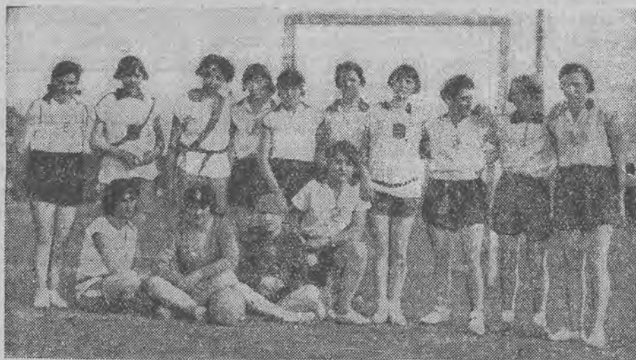
Hazena jest grą jeszcze niestety zbyt mało rozpowszechnioną wśród naszych sportmenek. Powyżej dajemy zdjęcia czołowych zespołów łódzkich LKS. i HKS-u.