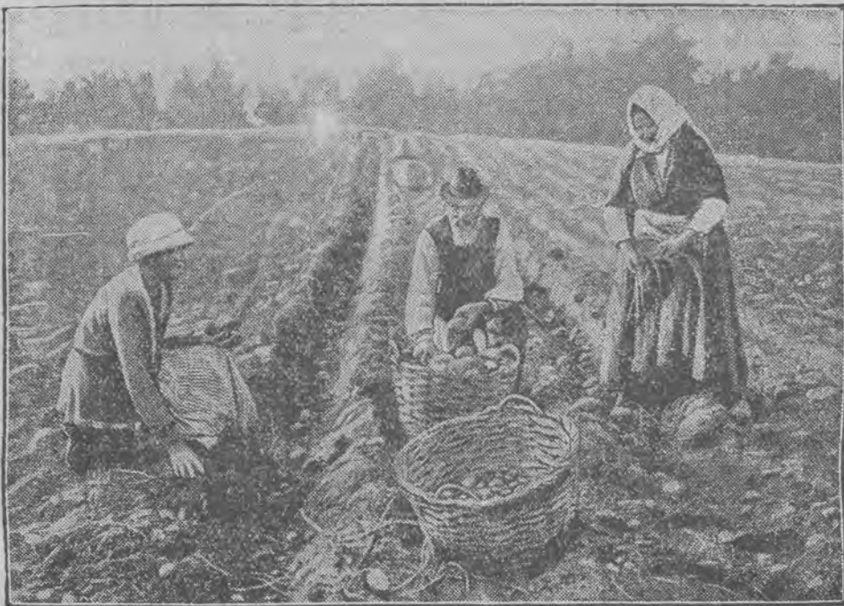
Zbiór kartofli rozpoczął się już w całej Polsce.

Dzisiaj w nocy dyżurują następujące apteki: G. Antoniewicza (Pabjanicka 50); K. Chądzyńskiego (Piotrkowska 164); W. Sokolewicz (Przejazd 19); R. Rembielińskiego (Andrzeja 28); J. Zurelewicza (Piotrkowska 25); Kasperkiewicza (Zgierska 54); S. Trawkowskiej (Brzezińska 56).