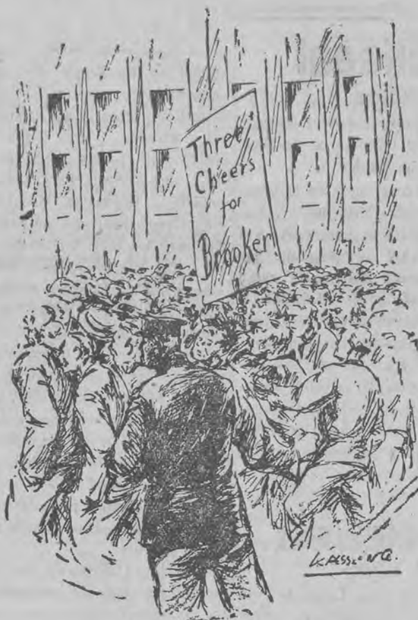
„Niech żyje Brooker!”.

chusteczki entuzjastycznie powiewały; brzmiały wesole okrzyki.