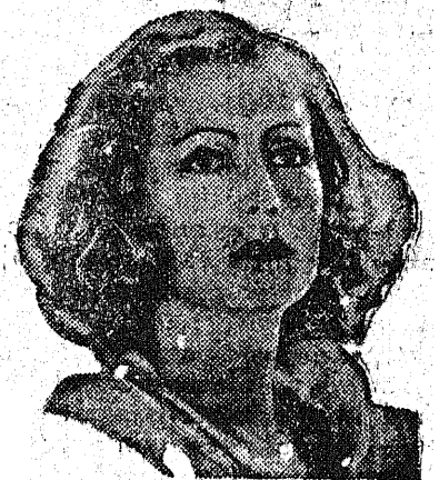
GRETA GARBO w fenomenalnym filmie „LUDZIE W HOTELU”