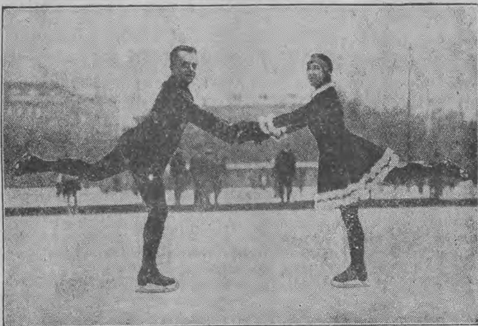
otrzymała w Wrocławiu I nagrodę na wszechniemieckim turnieju jazdy figurowej na łyżwach.