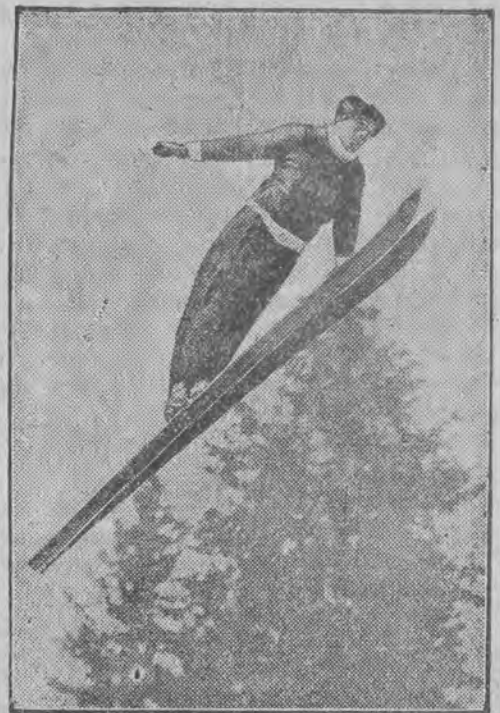
okazał się w Oslo jednym z najlepszych narciarzy.