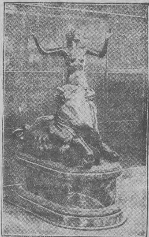
Statua brązowa, która zdobi jadalnię luksusowego statku transoceanicznego „Europa“

1-szy Dźwiękowy Kino-Teatr w Łodzi „SPLENDID“ Na aparatach „Western Electric“