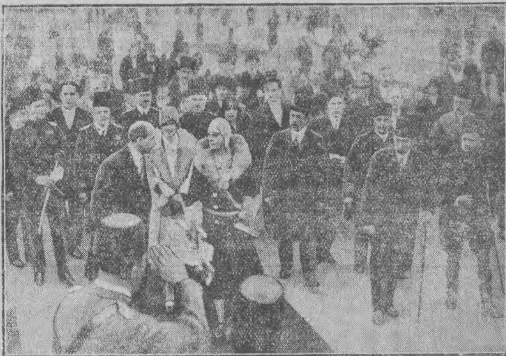
Królowa rumuńska Maria przybyła do Aleksandrii w odwiedziny do króla Egiptu Fuada. Towarzyszy jej w podróży córka Ileana (w białym płaszczu), sławna z zerwanych zaręczyn z hr. Hochbergiem pszczyńskim.