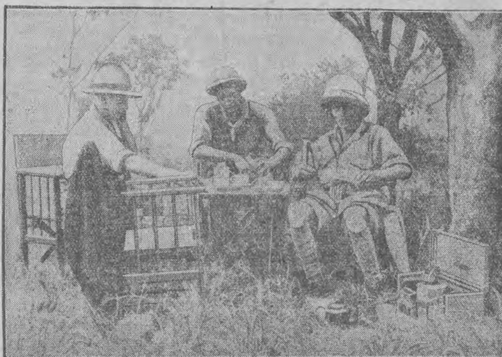
(na prawo) podczas ekspedycji myśliwskiej do Afryki środkowej, skąd właśnie powrócił do Londynu.