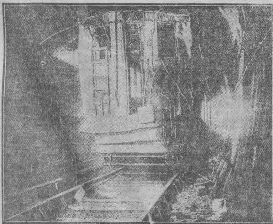
miała miejsce w Paryżu, przyczem 15 osób odniosło ciężkie a około 100 lekkie rany