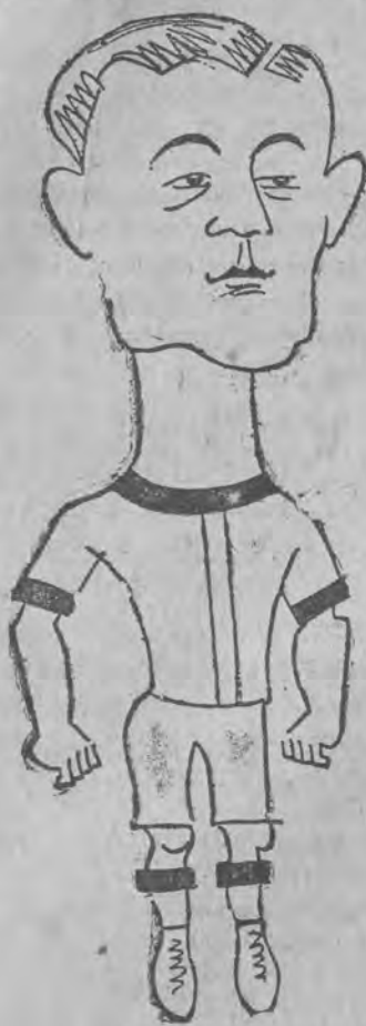
Jeden z najlepszych piłkarzy niemieckich (w karykaturze).