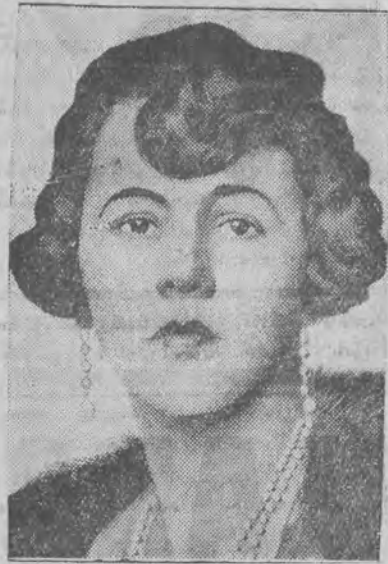
Arcyksiężniczka holenderska Juliana ma się zaręczyć z drugim synem następcy