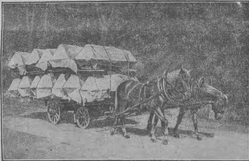
Trumny ze zwłokami 151 górników musiały być ładowane po kilkanaście na jeden wóz.