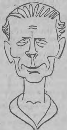
najlepszy tenisista zawodowy na świecie.