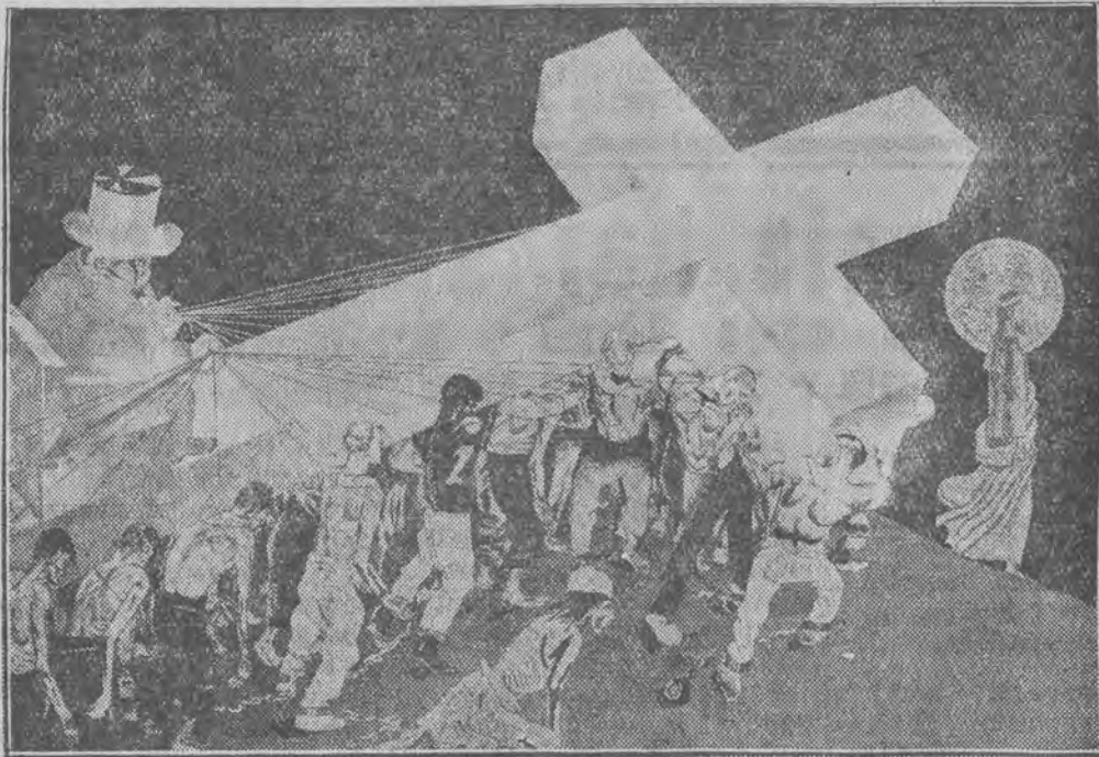
Kolportowany w Rosji plakat, wyobrażający wyznawców chrześcijaństwa w roli niewolników kapitalizmu.