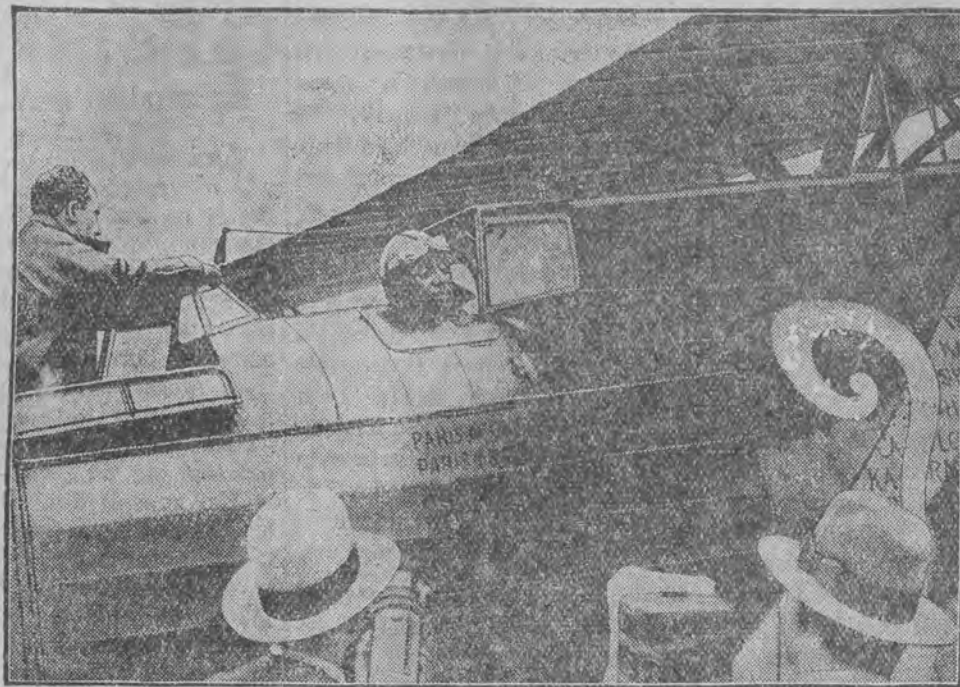
Francuscy piloci Costes (siedzi) i Bellonte (stoi) na swym aparacie „Znaku zapytania” bezpośrednio przed startem do zwycięskiego lotu przez Ocean.

Jako pierwszy bohaterów powitał płk. Lindbergh wraz z małżonką, dalej słynny tenisista francuski, Borotra i bo-