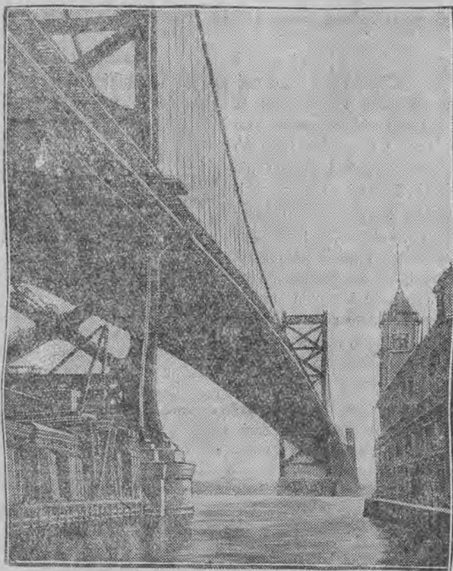
Most Delaware w Filadelfji (Stany Zjednoczone).