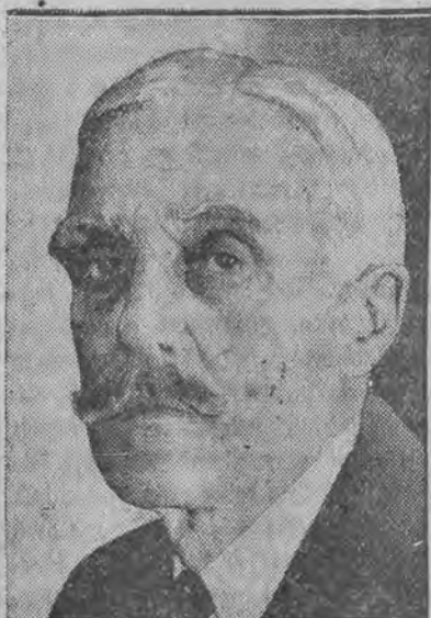
minister finansów Stanów Zjednoczonych