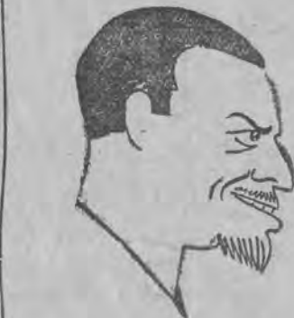
MINISTER GRANDI którego nagły wyjazd z Genewy wywołał szereg komentarzy.

Gdańscy urzędnicy policji kryminalnej aresztowali kilka osób, jednakże nie mogli im niczego udowodnić. Dopiero wczoraj w nocy aresztowano kupca Bornatza i asystenta pocztowego Junghansa, jako podejrzanych. Istotnie, w mieszkaniach ich w Sopocie znaleziono prasę do wyrabiania fałszyfikatów. Ciekawe jest, że zarząd kasyna zużył ogromne sumy na poszukiwanie fałszerzy żetonów w Berlinie i Hamburgu, nie przypuszczając, aby fabryka fałszywych żetonów mogła produkować je w najbliższym sąsiedztwie kasyna.