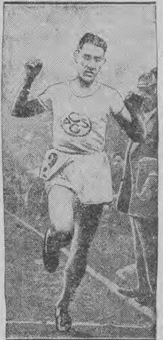
mistrz w biegu na 1500 mtr.