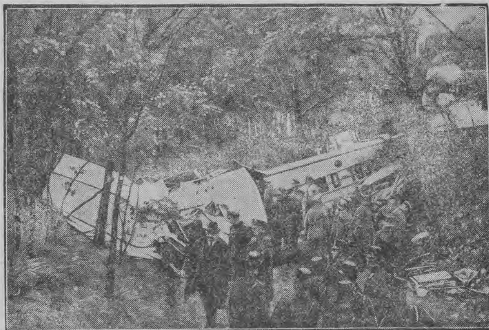
kursującego na linii Berlin — Wiedeń, który spadł pod Dreznem, przyczem 8 osób poniosło śmierć.