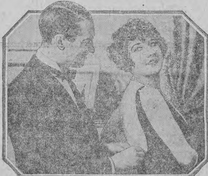
Najbliższy szlagier GRAND KINA.

najpopularniejszy artysta na kuli ziemskiej