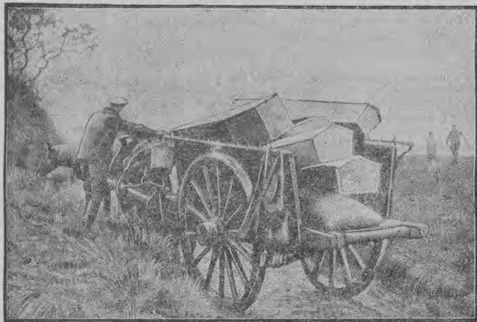
Transport prymitywnych trumien, w których prowizorycznie u mieszczono zwęglone szczątki 46 ofiar katastrofy olbrzyma napowietrznego „R. 101”.