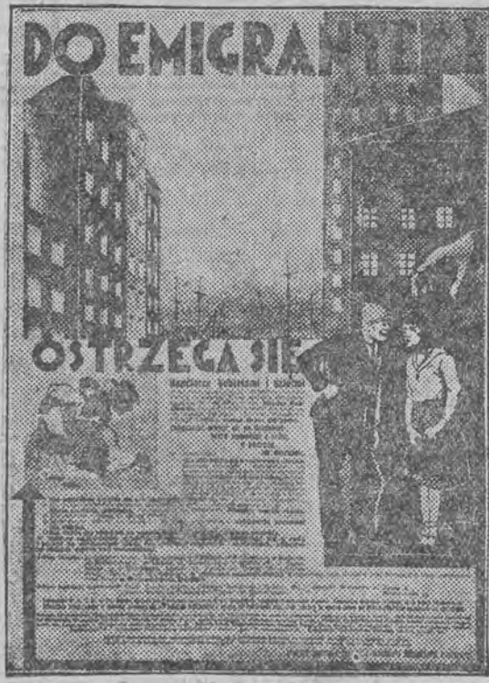
Afisz polskiego komitetu walki z handlem kobietami i dziećmi z powodu VIII międzynarodow. kongresu w Warszawie.

określony wiek, poniżej którego dziewczętom nie wolno byłoby usługiwać i występować w lokalach z wyszynkiem alkoholu.