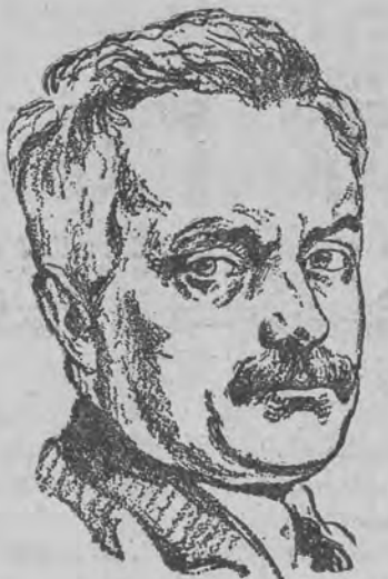
a jego następcą został mianowany Severing.