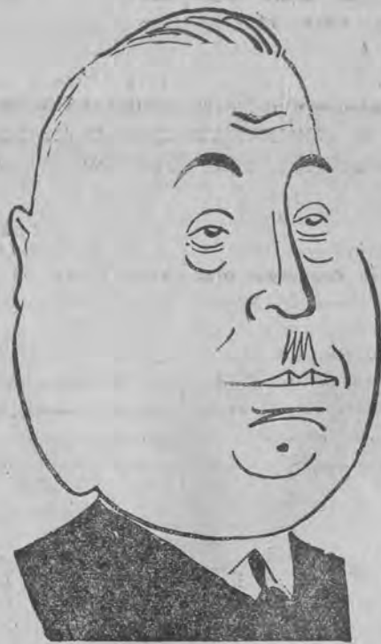
hitlerowiec, wiceprezydent Reichstagu.