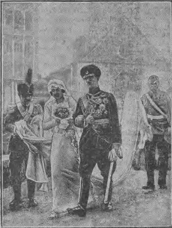
Młoda para po ślubie opuszcza kościół św. Franciszka.