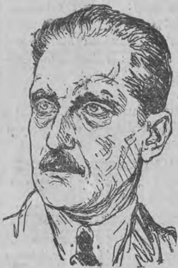
Pruski minister spraw wewnętrznych, dr. Waentig, ustąpił niespodziewanie,