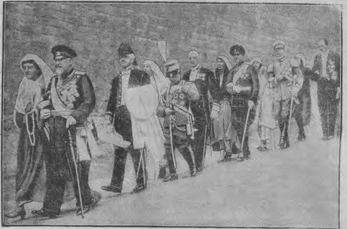
RODZICE I KREWNI W ORSZAKU WESELNYM: