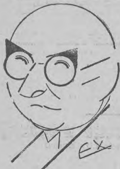
pruski prezydent rady ministrów.