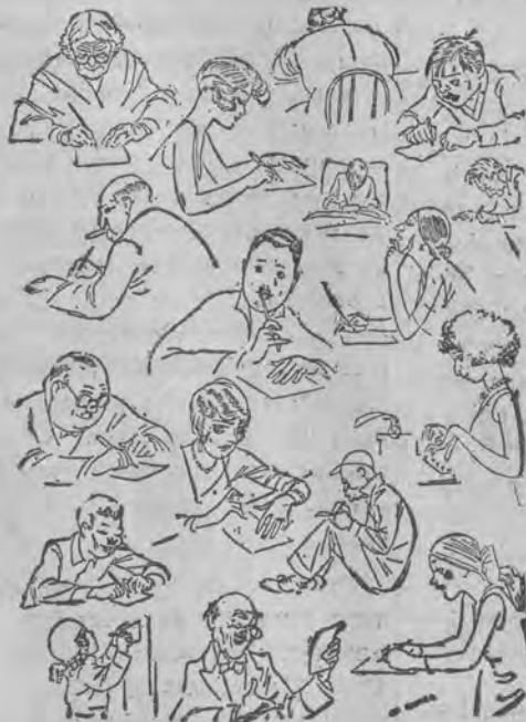
Kochana Gr eto Garbo...