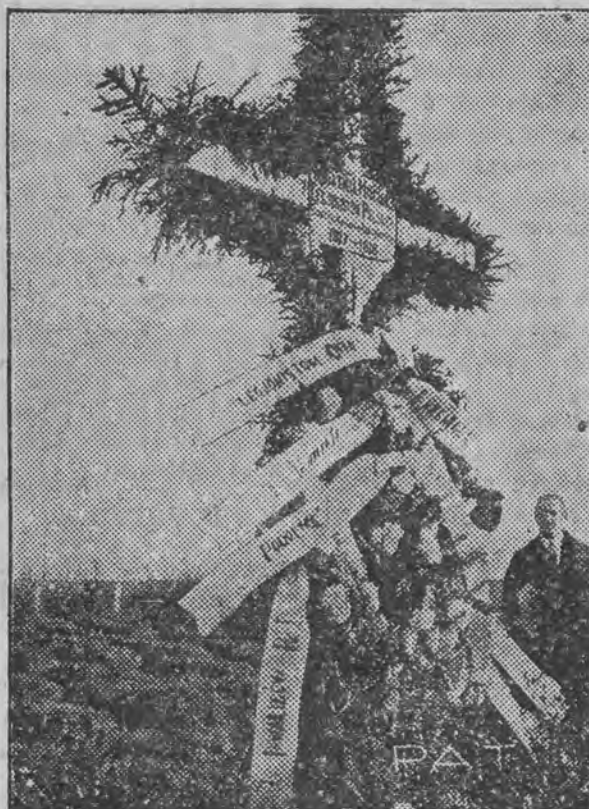
Krzyż na bratniej mogile legionistów smarłych w Szczypiornie.