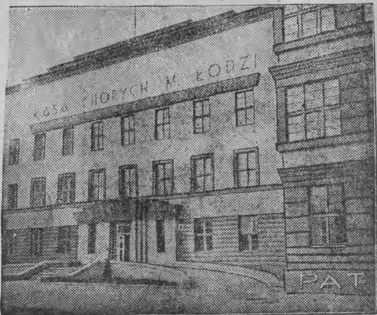
Nowy budynek kasy chorych przy ul. Łagiewnickiej.