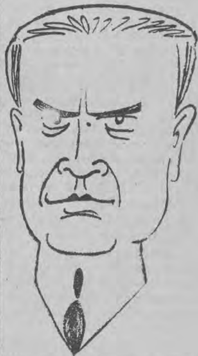
nowy prezydent Brazylii.