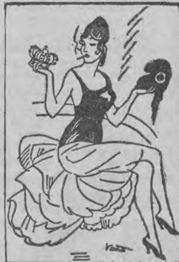
Carmen: — Ciekawe, w którym z tych nakryć głowy będzie najbardziej do twarzy?