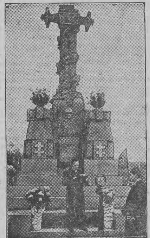
Pomnik poległych w Kownie wzniesiony z okazji 500-lecia śmierci ks. Witolda.