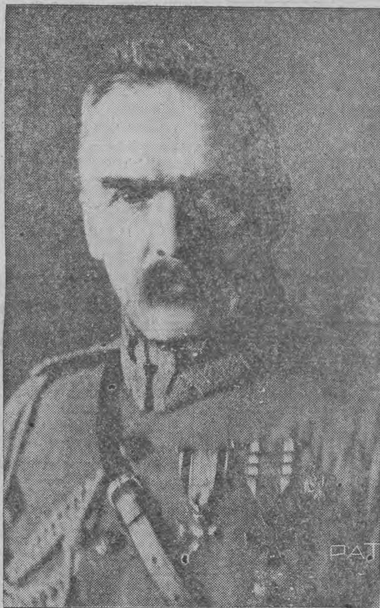
Pierwszy Marszałek Polski, Józef Piłsudski.

Kiedy potem w roku 1863 nieszczęśliwi powstańcy, następcy tamtych z roku 1848 czuli pętlę zaciskającą się koło ich szyi, wiedzieli, że czynią to ręce nie jednego zabojcy, ale wszystkich trzech. Tylko bowiem sojusznicy i współdziałanie wielkich mocarstw przypisać trzeba było to, że olbrzymi naród polski, posiadający wielkie tradycje odporności i potężną kulturę, nie mógł się przez tyle lat wydobyć z niewoli. To też powstanie dwóch różnych koalicji — z jednej strony państw centralnych, a z drugiej Francji i Rosji, które nastąpiło w latach 1882 — 1891, było zapowiedzią owej wymarzonej i wymodlonej „wojny narodów“, która ze snu o walce i zwycięstwie — stawała się zbliżającą rzeczywistością. Dostosować do tej realnej chwili warunki polskie, wyrzesać z 30-miljonowego narodu armję godną jego siły, któraby sprostała walce o byt narodowy, — to było zadanie, które za cel postawił sobie Piłsudski. Ileż trzeba było mieć wiary w sprawę w naród, aby wbrew wszelkim ówczesnym warunkom rozpocząć przygotowania do wojny z jedenastoma początkowo