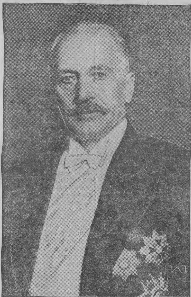
Prezydent Rzplitej, prof. Ignacy Mościcki.

W 12-tą rocznicę tryumfu sprawiedliwości dziejowej