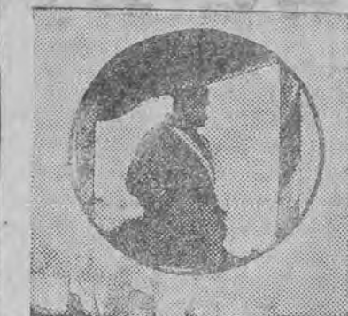
Marszałek Piłsudski przyjmuje defiladę na rewii na Polu Mokotowskim w Warszawie.

4) Bezwzględne stosowanie przez władze najwyższych kryteriów przy oznaczaniu wymagań technicznych, które doprowadziło już do zamknięcia szeregu drukarni w Polsce i spowodować może w dalszym ciągu zamknięcie licznych zakładów drukarskich grozi podcięciem podstaw finansowych szeregu wydawnictw i zamknięciem warsztatów pracy dziennikarskiej a w konsekwencji zniszczy wiele