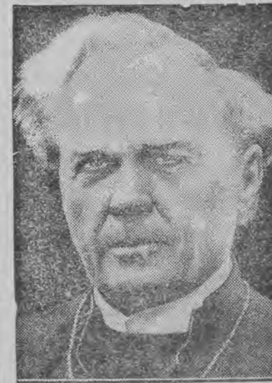
Szwedzki arcybiskup Soederblom