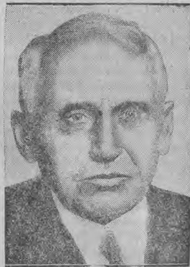
B. amerykański sekretarz stanu Kellogg.