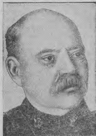
szef generalnego sztabu armii amerykańskiej podczas wielkiej wojny zmarł w 77-ym roku życia.