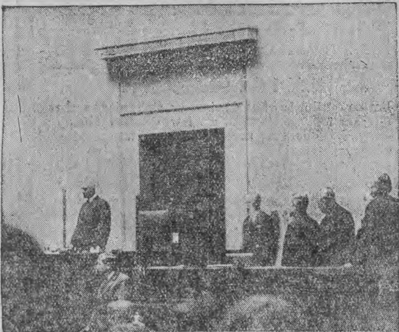
Zdjęcie z sali sejmowej. Na trybunie marszałkowskiej widzimy prezesa rady ministrów Ślaska, odczytującego oredzie p. prezydenta.