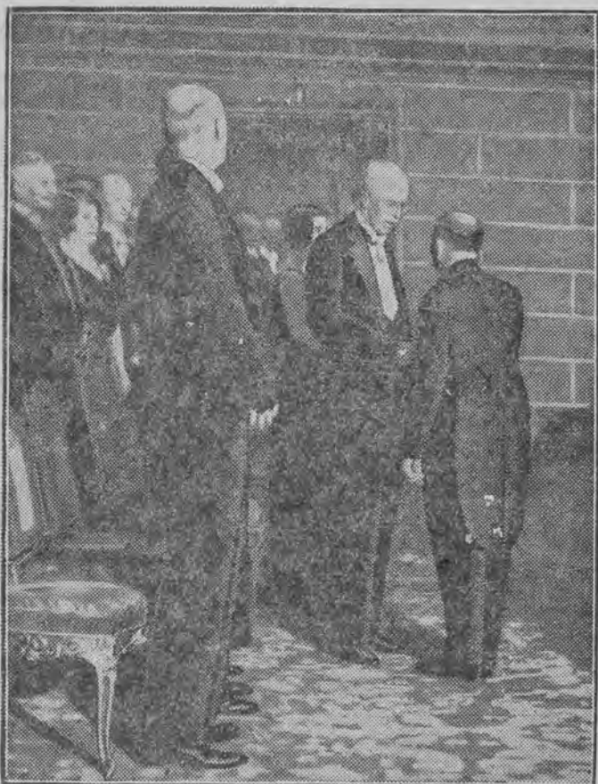
dokonał w Sztokholmie król szwedzki Gustaw (pośrodku) w dniu 10 b. m., jako w rocznicę śmierci fundatora nagród.