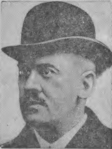
duński minister opieki społecznej, do którego w parlamencie podczas przemówienia wystrzelił z galerji jakiś bezrobotny, ale na szczęście chybił, bowiem w ostatniej chwili podbito mu rękę z rewolwerem w górę