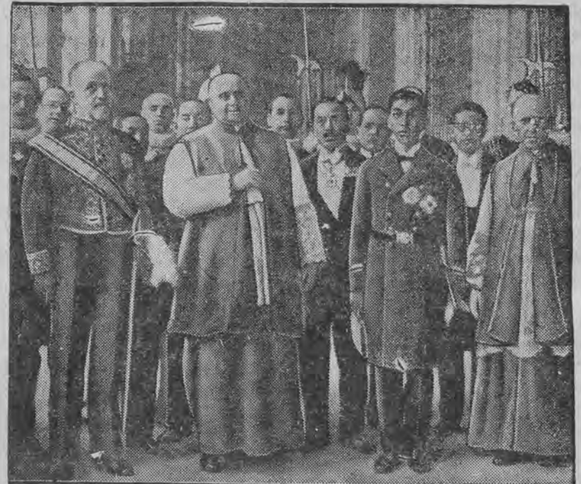
Brat mikada, ks. Takamatsu (pośrodku), który od szeregu miesięcy podróżuje po Europie, przybył również wraz ze świtą do Watykanu, gdzie był przyjęty na audjencji przez papieża.