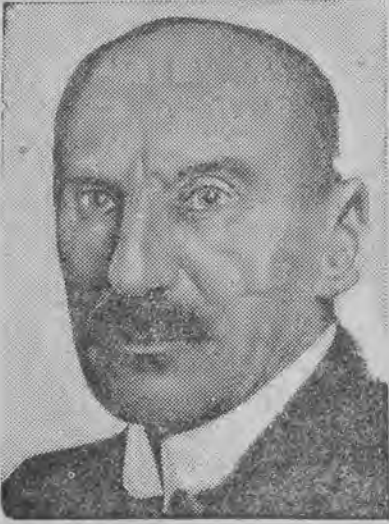
obrony prezydentem Szwajcarii na rok 1931.