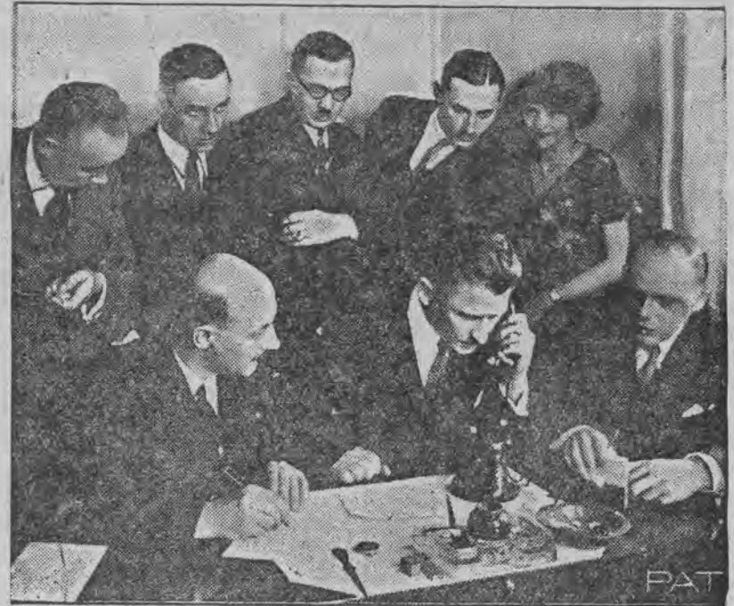
Redakcja „Dziennika Polskiego“ w Detroit otrzymuje telefoniczne rezultaty wyborów do sejmu z Warszawy.