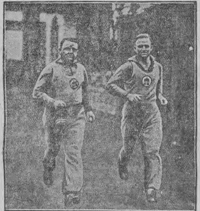
Gempe (na lewo), który utracił wzrok na froncie podczas wojny, brał obecnie udział w biegu na 15 kilometrów w Berlinie i osiągnął doskonałe wyniki. Energia ludzka bywa czasami niespożyta!