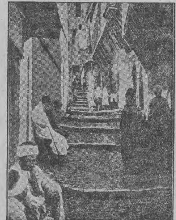
Rzut oka na zaułek, w którym wskutek obsunięcia się ziemi postradało życie przeszło 60 tubylców.