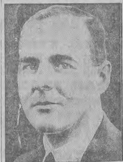
nowy poseł Rzeszy w Warszawie