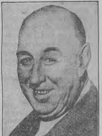
WILLIAM TOMPSON wysunięty przez Al Capone'a na stanowisko burmistrza Chicago został wybrany.

Udzielił on prasie obszernego interwju w którym wywodził, że czasy są coprawda ciężkie, ale on mimo to nie zamierza wejść na drogę pracy literackiej. Wprawdzie jeden z syndykatów prasowych ofiarował mu ryczałtem 2 miliony dolarów za napisanie pamiętników ale chwilowo ta oferta go nie interesuje.