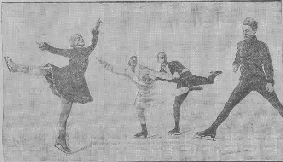
W damskiej jeździe artystycznej: Sonja Henie (Norwegia).