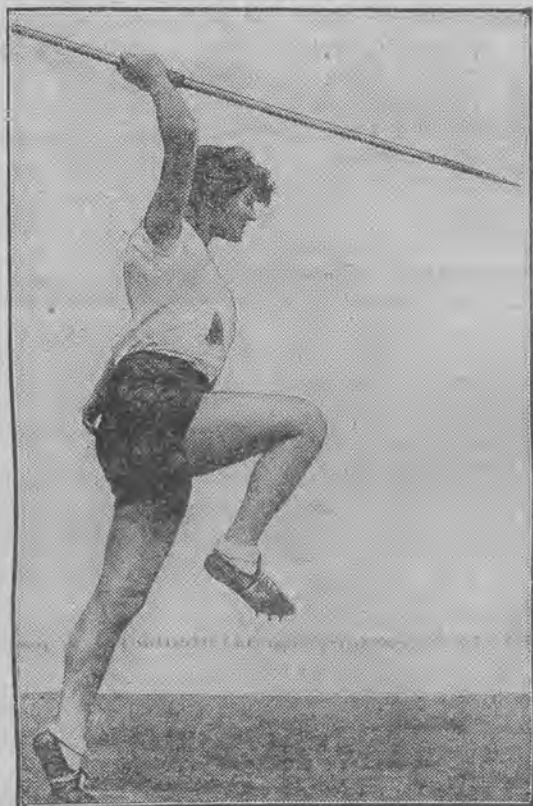
mistrzynie Niemiec w rzucie oszczepem, zaangażowana w charakterze instruktorki do Anglii.