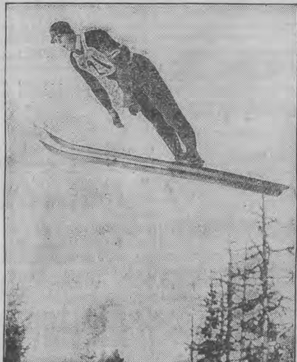
znakomity narciarz norweski, skoczył w Davos stojąc na odległość 81 metrów, co stanowi nowy rekord światowy.