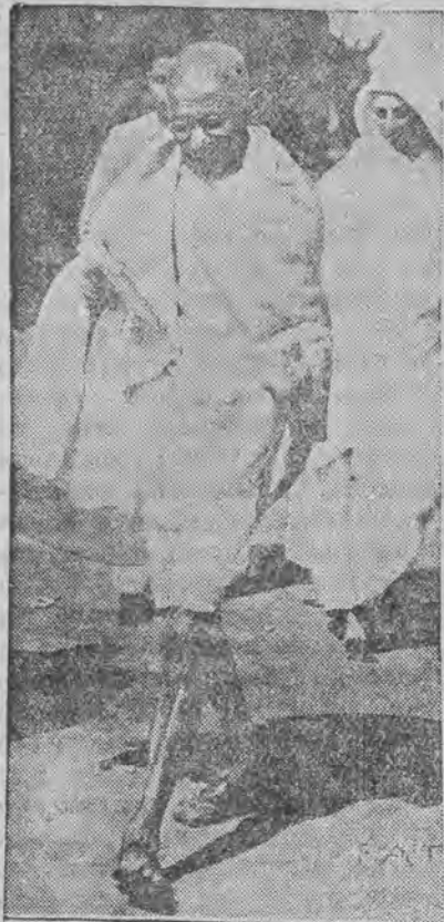
Mahatma Ghandi, wraca z ostatniej pomyślnej konferencji z lordem Irwinem.