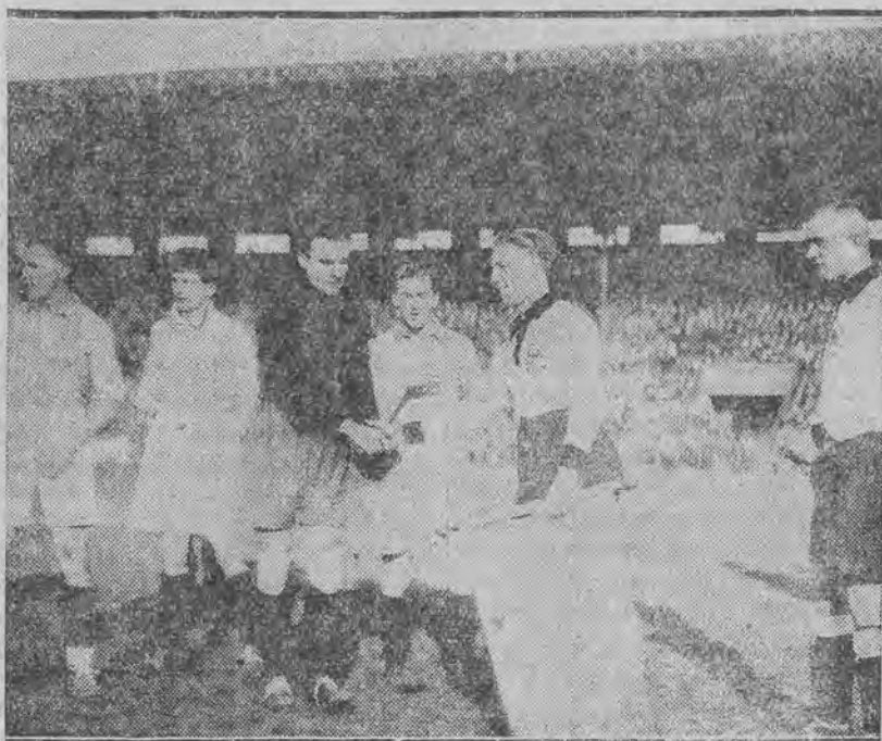
Kapitanowie drużyn wymieniają symboliczny uścisk dłoni.