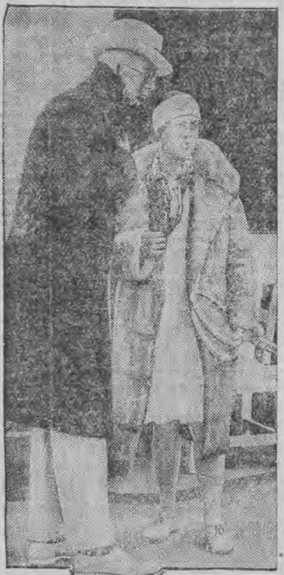
którego podczas meczu tenisowego z Cilly Aussem trafiła piłka w oko. Rozbite szkło okularów poraniło oblicze władcy, nie uszkodziwszy na szczęście oka