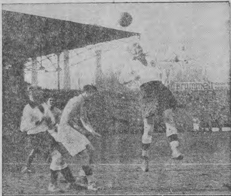
Gorąca chwila podczas pierwszej połowy gry.