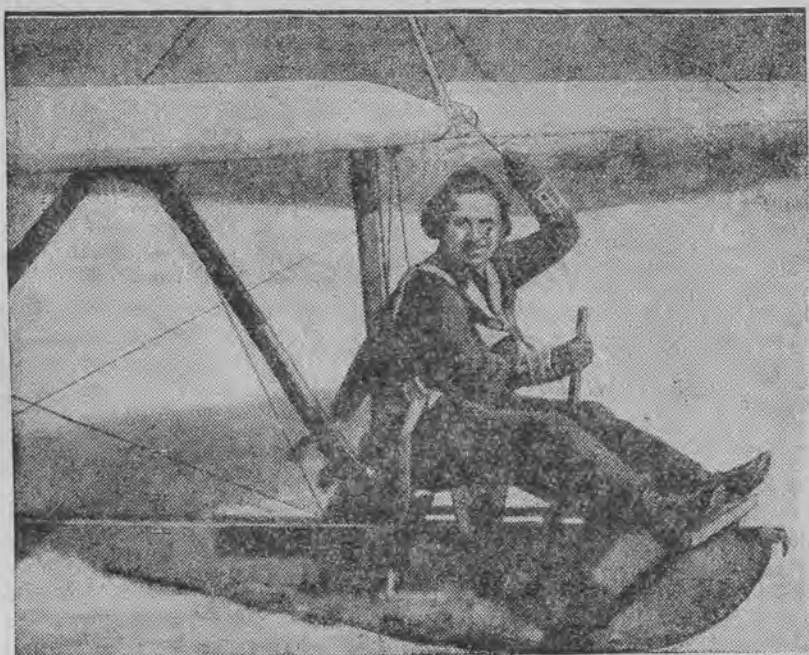
pierwsza dyplomowana pilotka nie miecka w samolotach bezsilnikowych.