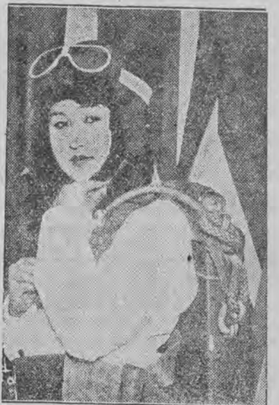
pierwsza japonka skacze ze spadochronem.