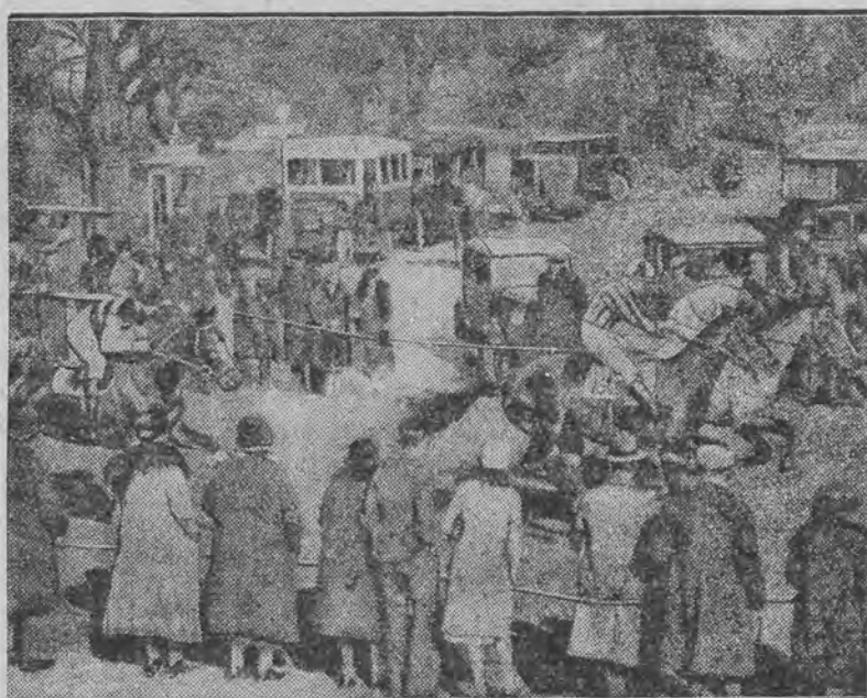
prowadzą w angielskim miasteczku Chelmsford przez środek głównej ulicy. Oczywiście cały ruch zamiera na ten moment.