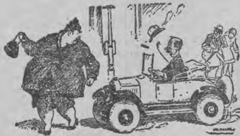
— Spróbuj mnie przejechać, młody człowieku, jeśli masz odwagę!