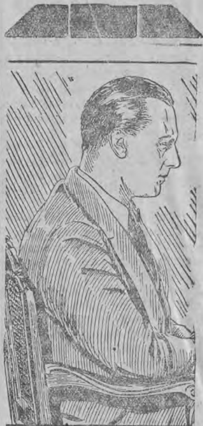
Dawno niewidziany, a przez pięć piękną oczekiwany