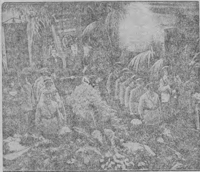
Przed spaleniem zwłok b. kanclerza w krematorium przemawia przyjaciel i towarzysz partyjny zmarłego dr. Breitscheid (pośrodku).