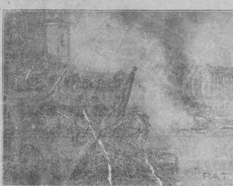
Płonący samolot w kilka chwil po katastrofie na dziedzińcu M. S. Wojsk.

Niestety — wszelka możliwość ratunku była spóźniona. Aparat splonął błyskawicznie, a w nim obaj lotnicy.