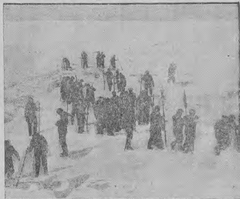
który spłonął wśród lodów usiłuje na krach lodowych przedostać się na stały ląd.