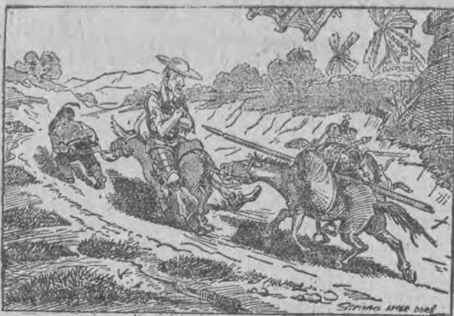
„Don Alfonso” według obrazu Dore'go.