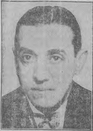
popularny powieściopisarz mianowany posłem hiszpańskim w Londynie.