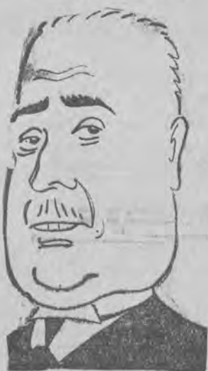
prezydent nowej republiki hiszpańskiej.