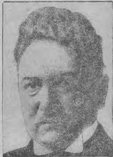
nowy premier norweski, przywódca partii chłopskiej