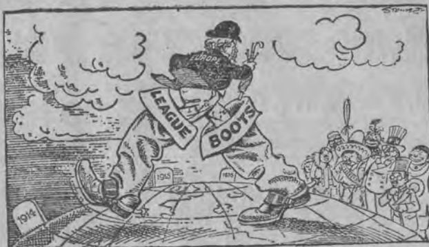
Sołidarność Europy cofa się

Być może, że Brianda zgubiła zbyt głośna reklama, jaką mu robił Blum. Sam fakt, że kandydatura Brianda była niezwykle silnie (może zbyt silnie...) popierana przez socjalistów, mógł wystarczyć we Francji do tego, aby ją zaprzepacić. Kto zna stosunki francuskie, wie, że kandydatury skrajne (lub protegowane przez partje skrajne) nie cieszą się tam