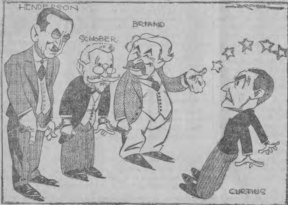
Jak liga narodów broni niepodległości Austrii. (Karykatura niem. na przebieg obecnej sesji rady ligi).

Wielka różnica poglądów ujawniła się w sprawie wniosku niemieckiego, ażeby różnym krajom przesłać jednolity, ściśle określony szemat pytań w sprawie stanu ich zbrojeń. Henderson zwalczał ten wniosek, z tego powodu, że do prowadzi on do dalszego opóźnienia w przeprowadzeniu konferencji rozbrojeniowej. Również Briand wystąpił przeciwko niemieckiemu planowi, jakkolwiek niemiecki plan jest — jego zdaniem — dobry, może nawet zbyt dobry, poza stając jednak w sprzeczności z pewnymi zasadami, opracowanymi przez komisję przygotowawczą konferencji rozbrojeniowej.