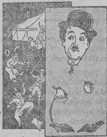
CHARLIE CHAPLIN „CYRK“

Początek w święta i niedziele o g. 12 w p. w dni powszednie o godz. 4 p. p. Na pierwsze seanse ceny miejsc od 50 gr.