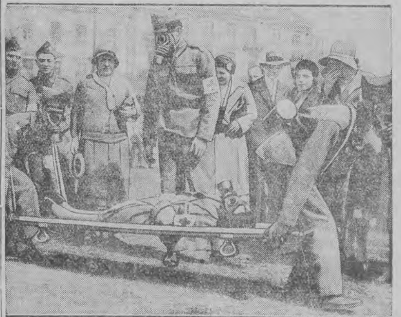
Interesująca grupa na ulicach stolicy.