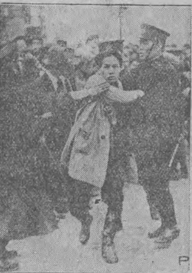
Aresztowanie przez policję w Tokio jednego z demonstrantów.