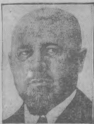
Obecny premier Prystor