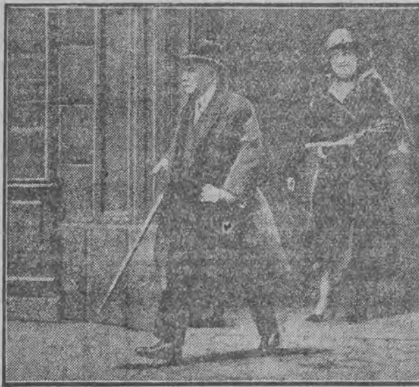
Pan Doumergue wziął ślub z p. Jeanne Grave na 24 godziny przed opuszczeniem pałacu Elizejskiego