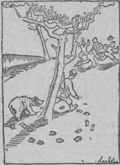
— Zdaje mi się, że znalazłem ślady niedźwiedzia...