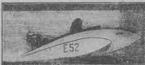
własność hiszpana Ivanray'a zdobyła rekord światowy, przebywała trasę z szybkością 90 kilometrów na godzinę