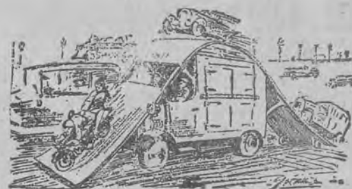
Auta ciężarowe na ożywione ulice miast.

Kto miluje zwierzęta powinien być członkiem Towarzystwa Opieki nad Zwierzętami.