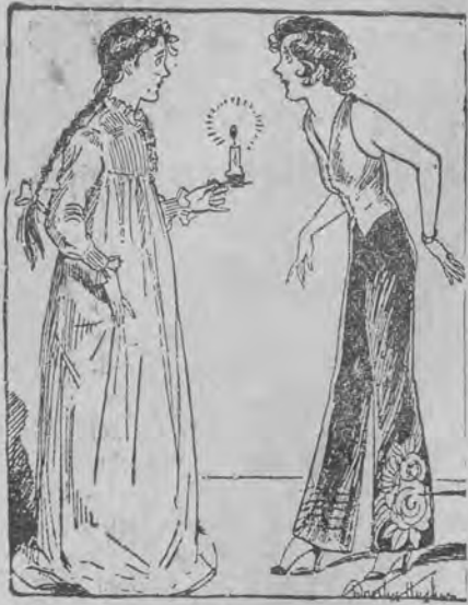
Dawniej i dziś