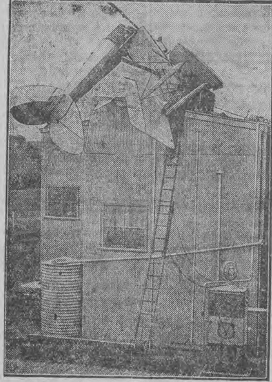
Uczeń na pilota, który spadł z maszyną na hangar, wyszedł szczęśliwie z katastrofy jedynie z podbitym okiem.