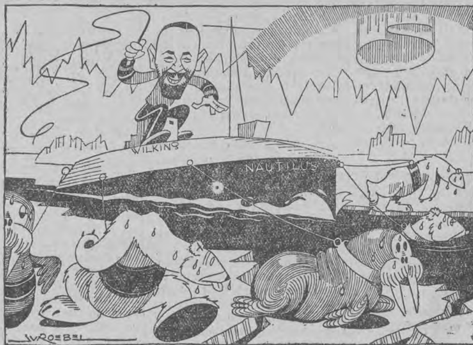
W taki sposób „Nautilus” mógłby bez maszyn dotrzeć do bieguna.