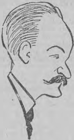
nowy prezydent senatu francuskiego