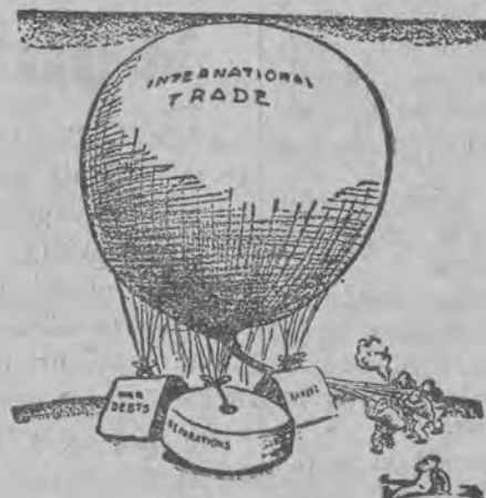
nie może się podnieść bowiem obciążony jest długami powojennymi, reparacjami i taryfami celnymi