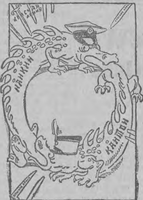
Dwa chińskie smoki, które się bez przerwy kasaają w ogony