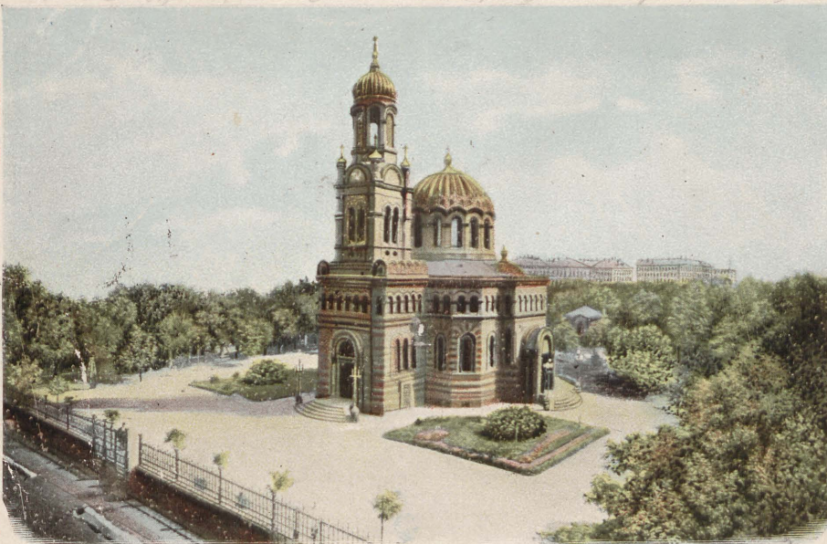
Łódź, Prawosławna Cerkiew Św. Alexandra.

г. ЛОДЗЬ, Православная церковь „Св. Александра“