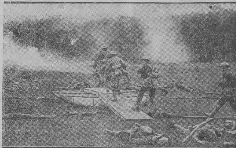
Fragment z manewrów na wielkim terenie ćwiczebnym w Aldershot.

Prywatne Pogotowie Lekarskie Zielona 6. 12-333 Telefon: