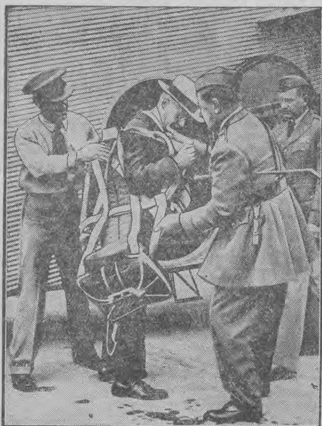
Amerykański sekretarz stanu Stimson zakłada spadochron przed podróżą samolotem z Waszyngtonu do Nowego Jorku