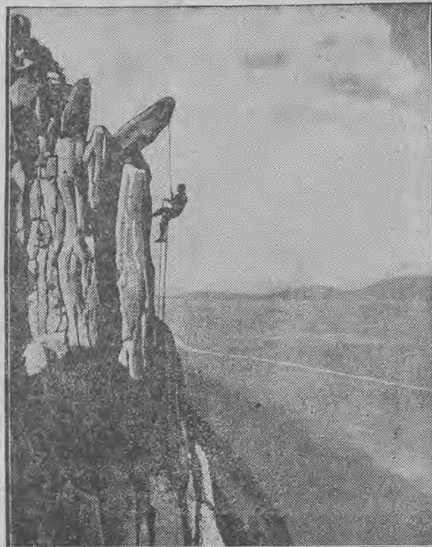
musi mieć miłośnik trudnych wycieczek górskich