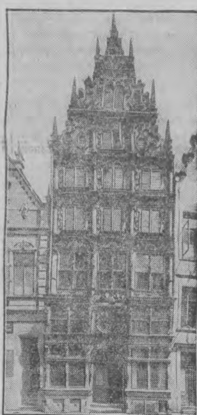
Dom Robinsona — nowoczesny budynek w Bremie, przy wejściu do którego na drewnianych tablicach wypisano historję Robinsona Kruzoe, który pochodził z tego miasta