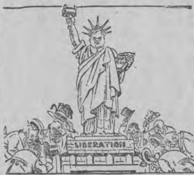
Amerykańska Statua Wolności.